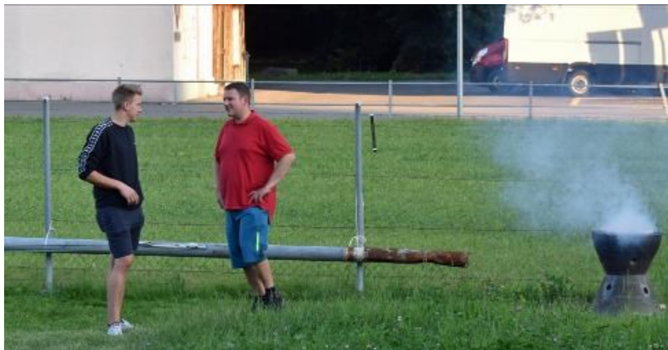
Klubleben, wie es heute nicht selbstverständlich ist: Fachsimpeln und grillieren auf dem „Düsengrill.“

Die weiteren geplanten Vereinsaktivitäten im vergangenen Jahr sind dann leider mehrheitlich der Corona-Pandemie zum Opfer gefallen. Zwischendurch war ein Treffen im kleinen Kreis möglich, die Freude währte aber nur kurz. Immerhin konnte in kleinen Gruppen die eine oder andere Arbeit erledigt werden. Die Beteiligung war während dieser Zeit erfreulich hoch – hoffen wir, dass dies so bleibt. Die Anlagenplanung und damit auch der Anlagenbau mussten jedoch ruhen.