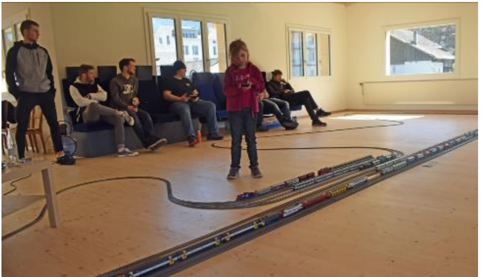
Oben: Auch die Kleinsten können Lokführer sein - Modelleisenbahn für alle! Unten: Fotograf auf dem Bauch - Bahnhof aus Sicht eines 1:87- Männchens.

Übrigens, auch zu Beginn der Modelleisenbahn frönten die gesetzteren Herren der Teppichbahn. Die Modelleisenbahn war ja zu teuer und wertvoll für Kinder.