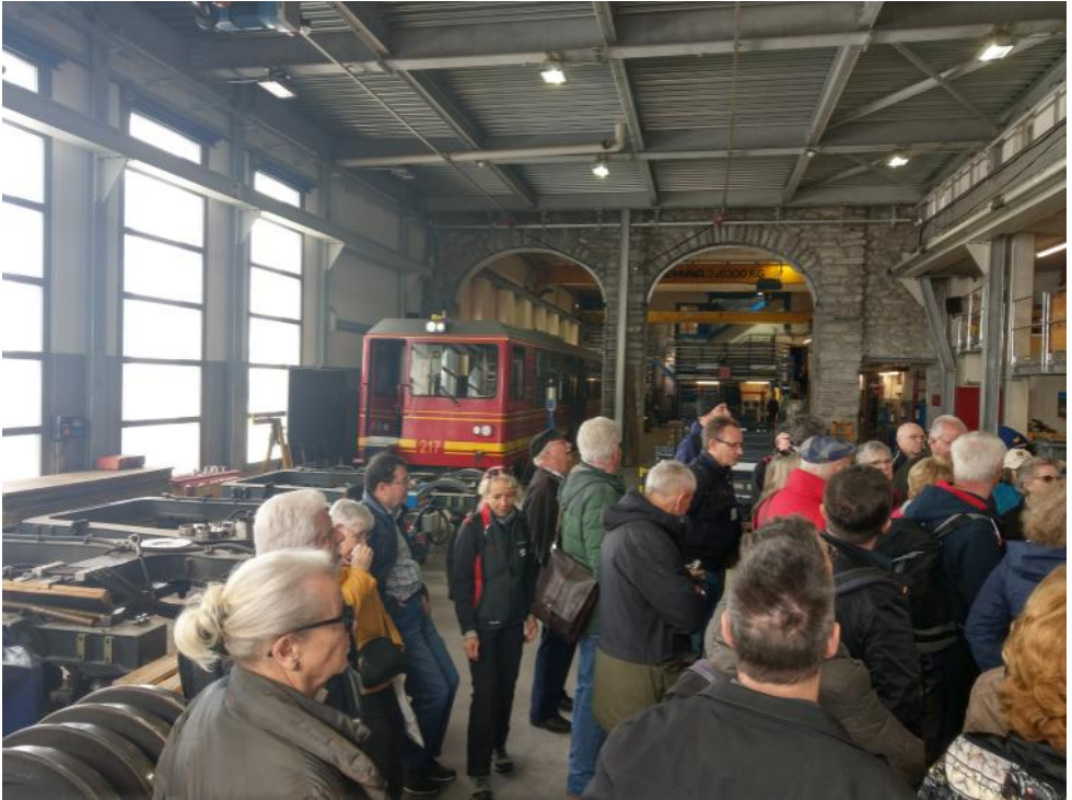
Oben: Besuch der Werkstätte Eigergletscher