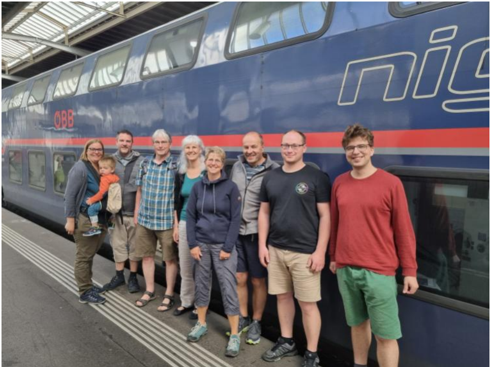
Unsere Reisegruppe vor dem Nightjet