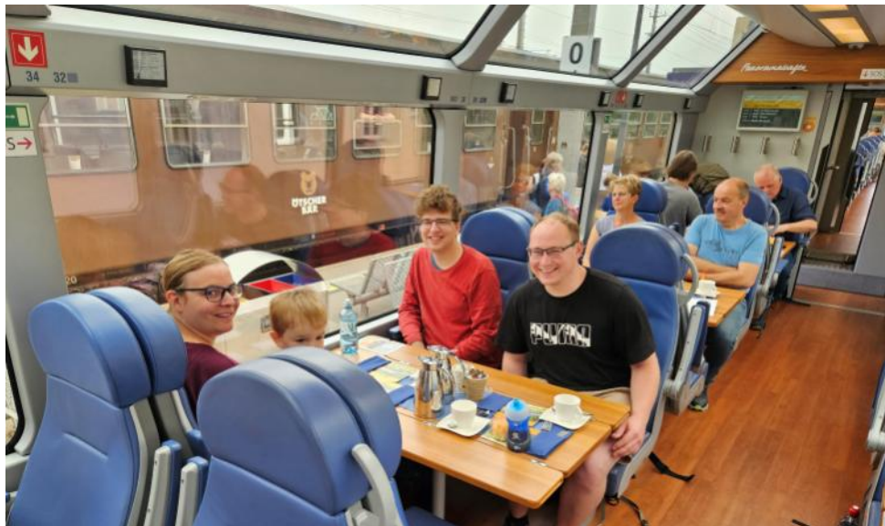
1. Juli 2023