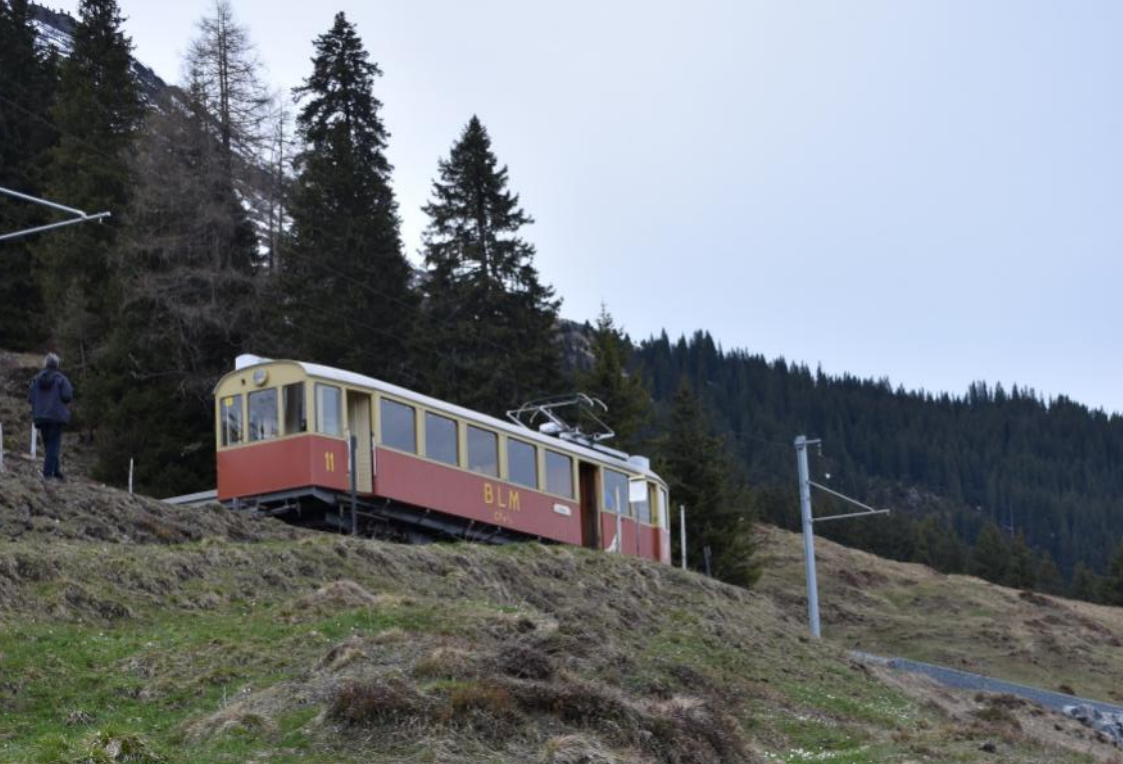
Oben: BLM CFe 2/4 bei Winteregg Unten: BLM CFe 2/4 vor der Staubbachbrücke