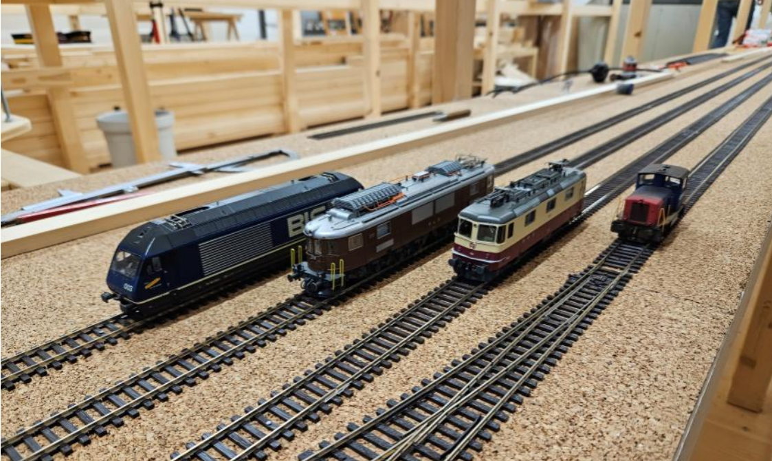
Lokparade auf den ersten vier Gleisen im Schattenbahnhof.