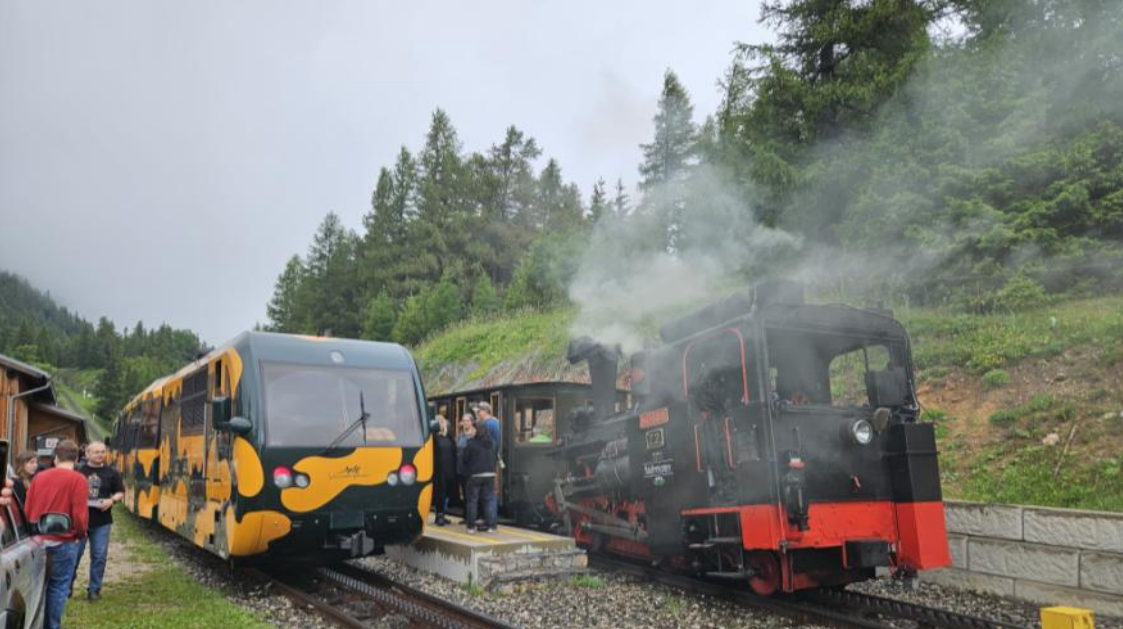
Kreuzung in Baumgartner. Der Alpensalamander trifft auf Dampfzug