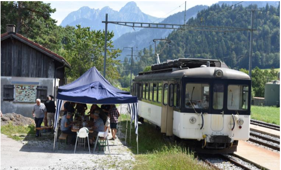
13. August 2023