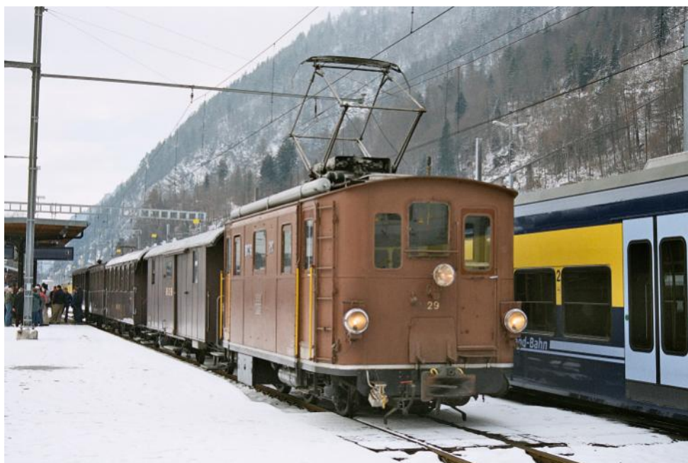
31. Januar 2007