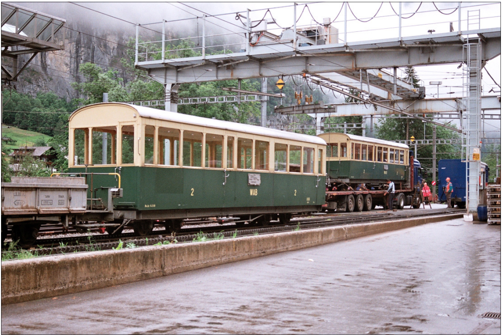
Verlad der WAB-Wagen 36 und 38 auf die rumänischen Lastwagen.