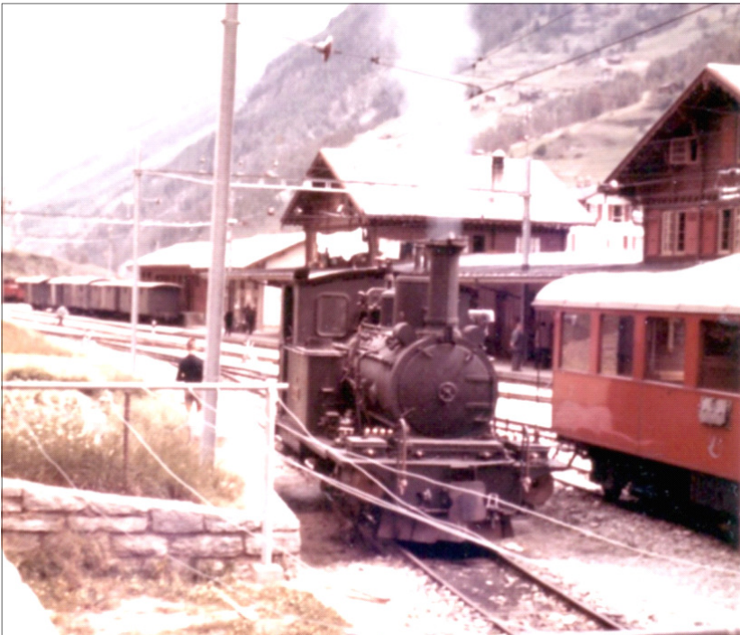
Oben: Eine HG 2/3 beim Manöver in Zermatt.