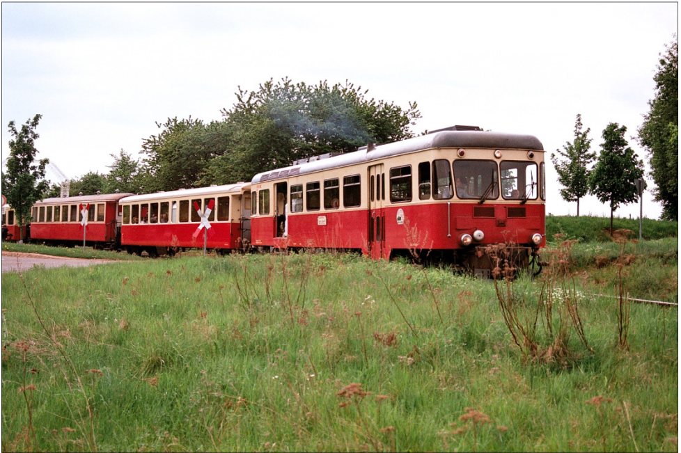
Oben: MEFEZ-Reise 2008: Talwärtsfahrender Zug der Brohltalbahn in Engeln nach dem Aussteigen der MEFEZ'ler