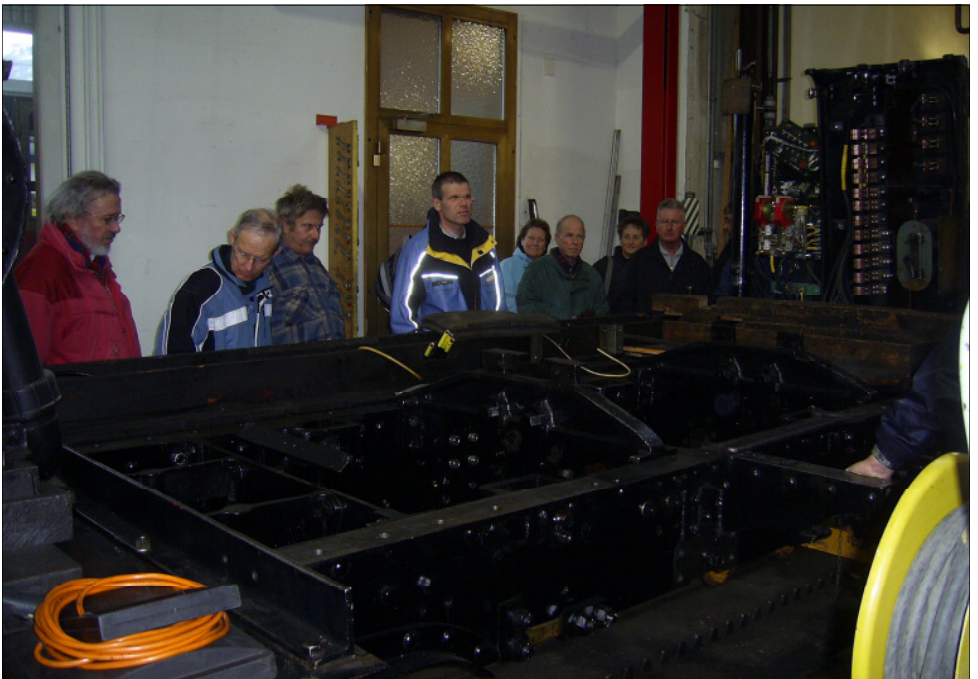
26. Januar 2008