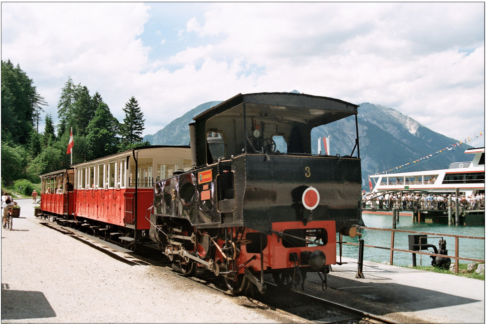
Zur Klubreise 2009: Zug der Achenseebahn am Achensee.