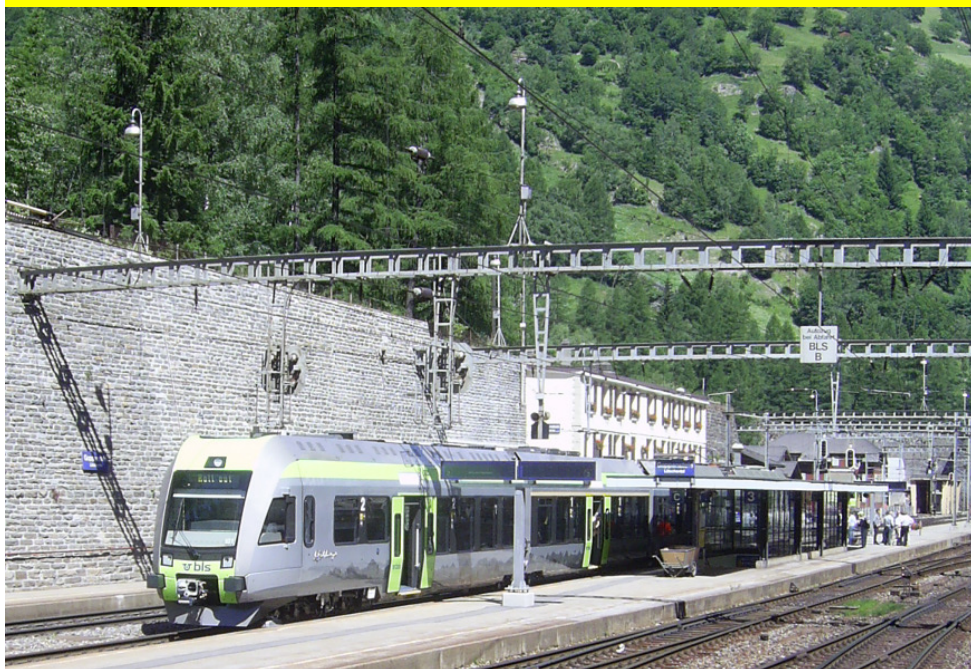
Der „Lötschberger“ macht auf seiner ersten Fahrt über den Lötschberg in Goppenstein Rast. Foto: Andreas Häsler, 28. Juni 2008

Nachrichtenblatt der Modelleisenbahnfreunde „Eiger“ Zweilütschinen Juli 2008 32. Jahrgang Ausgabe 1/2008