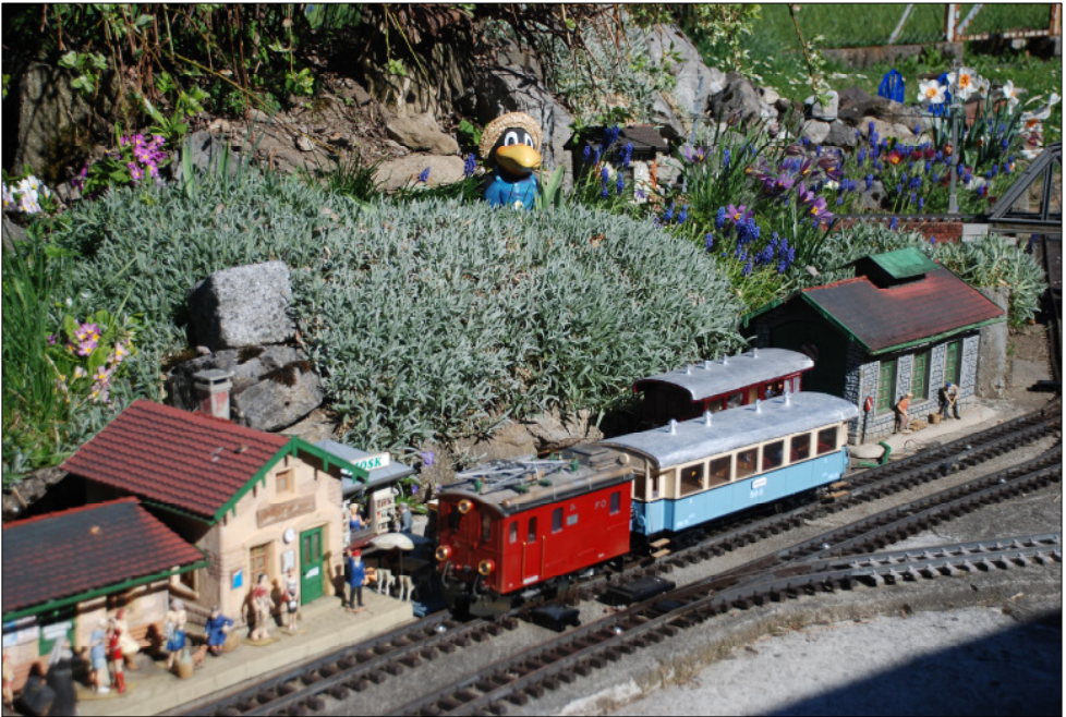
Die FO HGe 2/2 24 wartet mit dem neuesten Eigenbau, dem Schöllenenbahn-Steuerwagen AB 24, auf die Abfahrt.