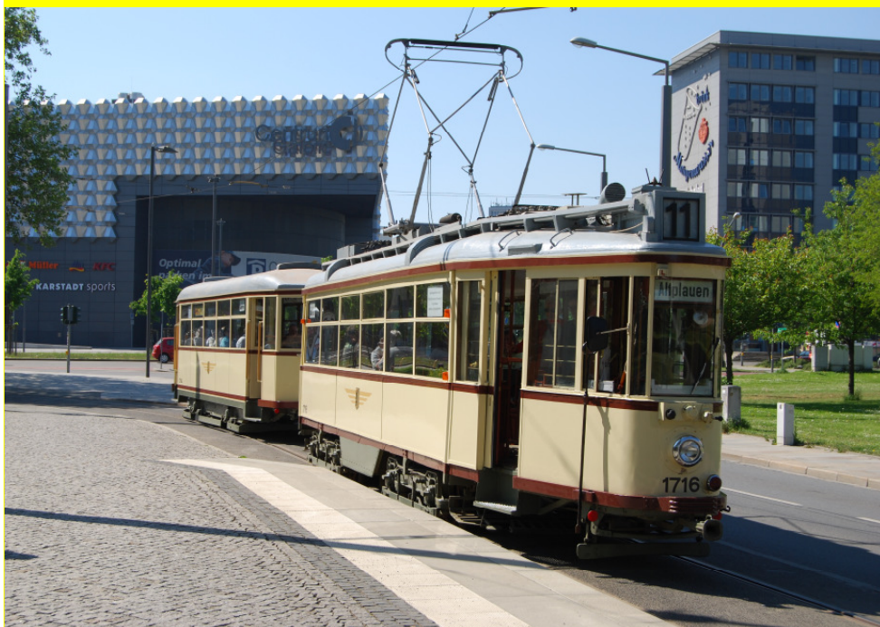
Der „grosse Hecht“ 1716 mit Beiwagen unterwegs mit dem MEFEZ in Dresden Foto: Andreas Häsler, 9.5.2011

Nachrichtenblatt der Modelleisenbahnfreunde „Eiger“ Zweilütschinen Juli 2011 35. Jahrgang Ausgabe 1/2011