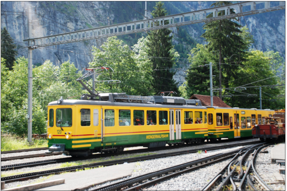
Oben: Der umgebaute BDhe 4/4 120 in Lauterbrunnen, Unten: Die Werkstätte BOB Zweilütschinen nach der Sanierung,