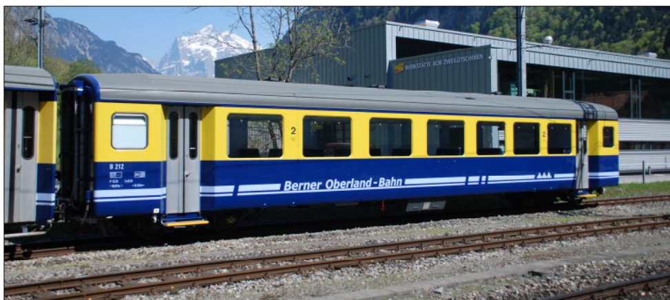
Der neue B 212 in Zweilütschinen,

Die umgebauten BDhe 4/4 120 und 121 sind in Betrieb genommen worden. Analog des Triebwagens 104 wurden eine Umrichteranlage und Asynchronmotoren eingebaut. Die Leistung beträgt neu 600 KW (früher 440 KW): Neue Vorstelllast auf 180 Promille ist 28 Tonnen statt vorher 22 Tonnen. Der Triebwagen 123 befindet sich im Umbau.