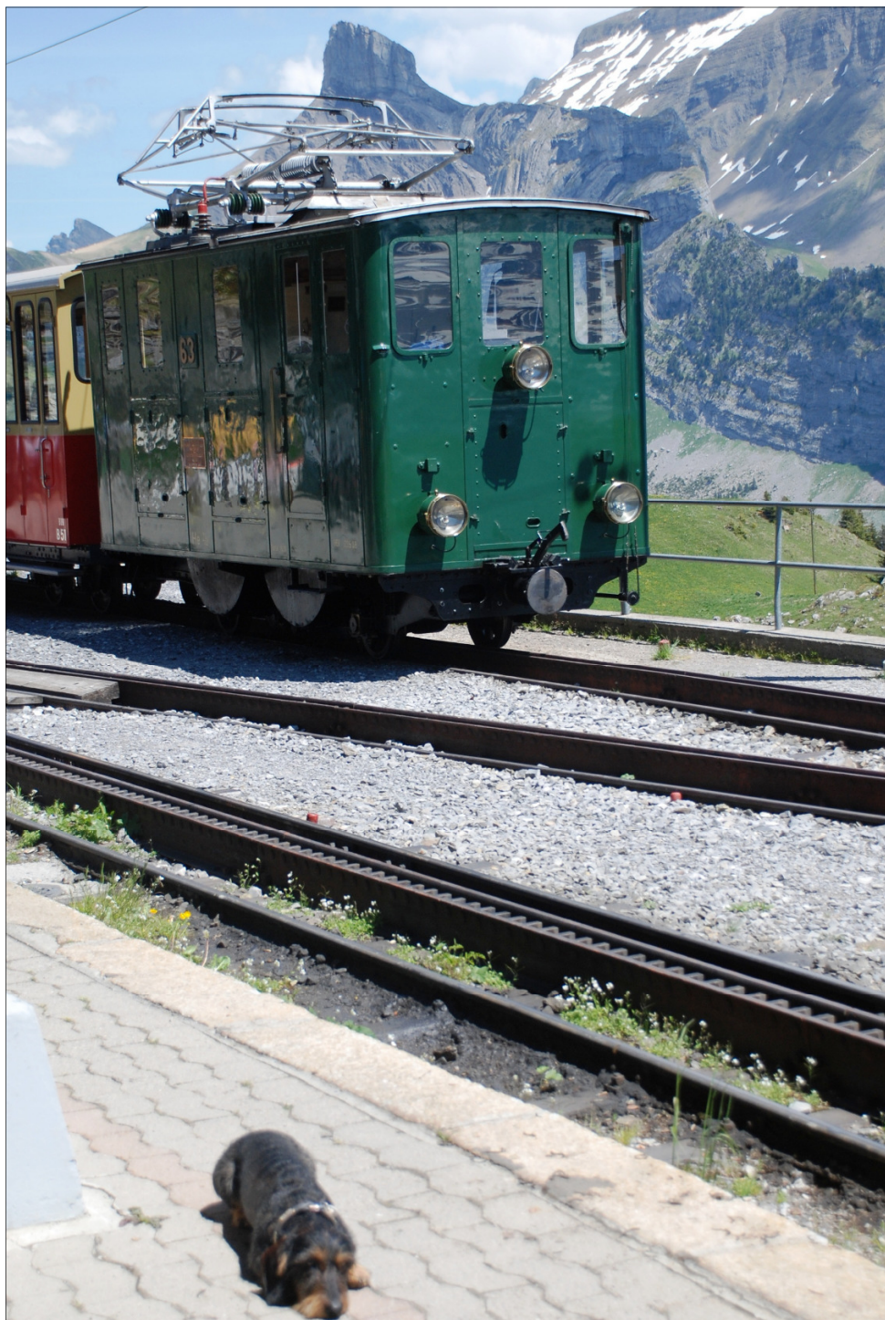
Agent 003 bewacht die historische Lok He 2/2 63, Schynige Platte.