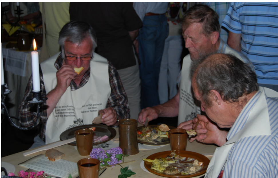
Nachtessen im Mittelalter

Wir von der Reiseleitung haben die Reise sehr genossen. Wir danken Euch für die zahlreiche Teilnahme!