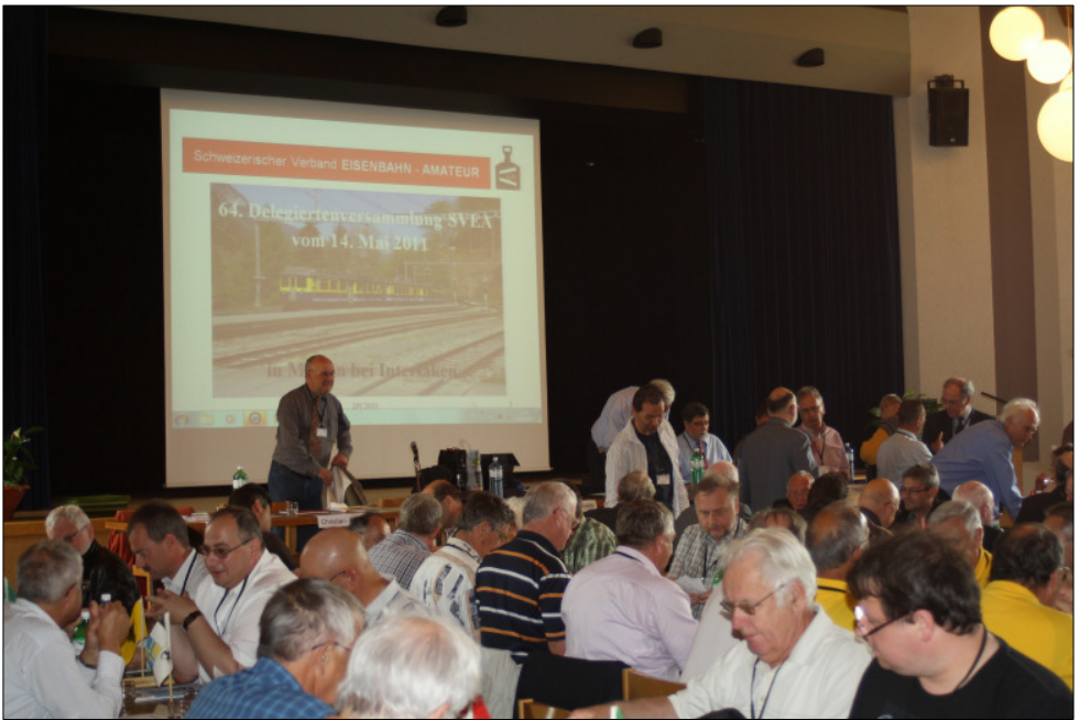
Oben: Die Delegiertenversammlung ist in vollem Gang