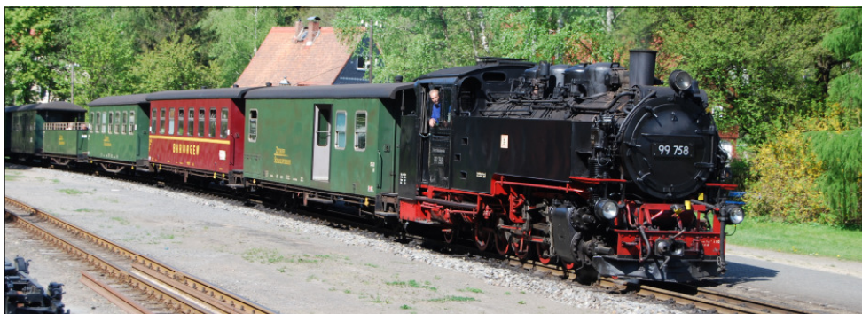
99 758 erreicht mit ihrem Zug Bad Oybin

Der dritte Tag stand im Zeichen einer Fahrt in die Oberlausitz. Diese Region liegt im Dreiländereck Deutschland, Tschechien, Polen. Der eigentliche Grund für uns Eisenbahnfreunde war die dortige Sächsisch-Oberlausitzer Eisenbahnge-